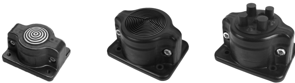
SCG 1x3-35 (IP55)

Az MC és SCG nyitható kábelbevezetők üzemi hőmérséklete -40 °C és +90 °C közötti tartományban van, és bel- és kültéren is alkalmazhatók.