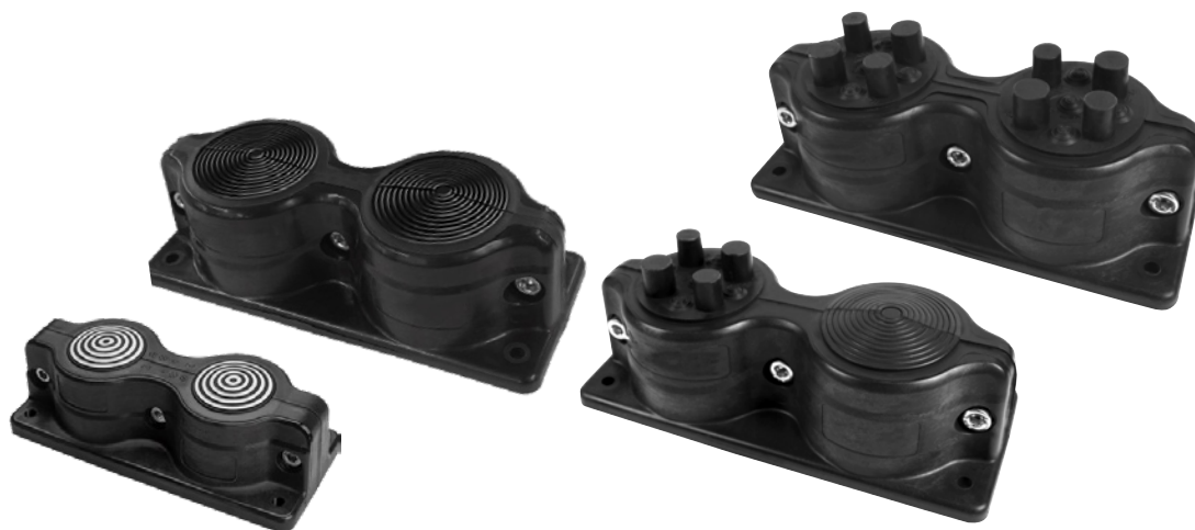
SCG 2x3-35 (IP55)